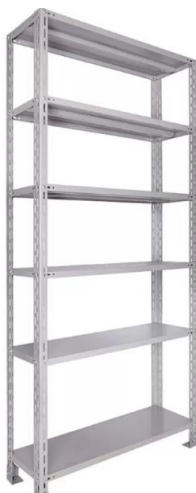
IMAGEM DE REFERÊNCIA - ITEM 09