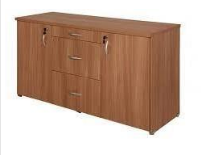
IMAGEM DE REFERÊNCIA - ITEM