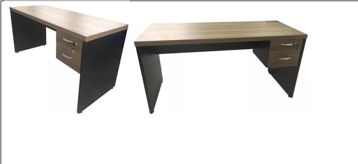
IMAGEM DE REFERÊNCIA - ITEM 03

Rua Amandio José de Carvalho, nº 371 – Centro. CEP 39.508-000 – Jaíba – Estado de Minas Gerais E.mail: tesourariacamarajaiba@hotmail.com - Telefone (38) 3833-1492