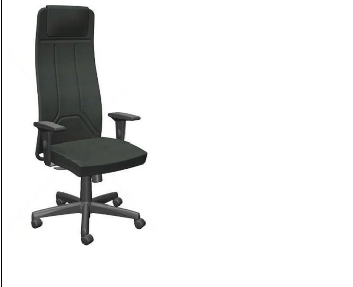
IMAGEM DE REFERÊNCIA - ITEM