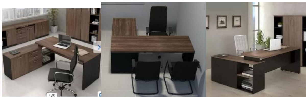
IMAGEM DE REFERÊNCIA - ITEM 01