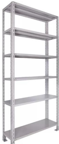
IMAGEM DE REFERÊNCIA - ITEM 09