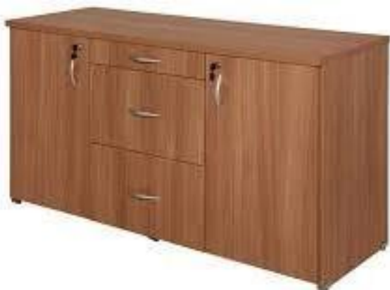
IMAGEM DE REFERÊNCIA - ITEM 03